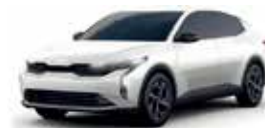
Clear White (L)