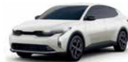
Snow White Pearl (LX, EX, EX PACK, GT-Line)