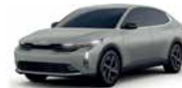
Steel Gray (L, LX, EX, EX PACK, GT-Line)