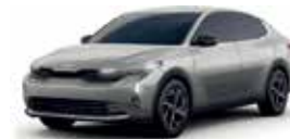
Silky Silver (L, LX, EX, EX PACK)