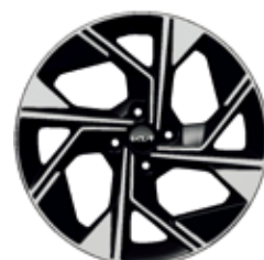
Rin de aluminio 17" GT-Line (TA)