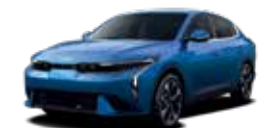
Wavy Blue (exclusivo GT-Line)