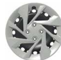
Rin de acero de 15" con tapón decorativo L (TA)