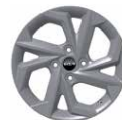
Rin de aluminio 15" LX (TM, TA)