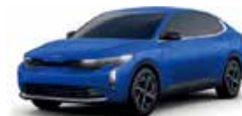
Azure Blue (LX, EX, EX PACK)