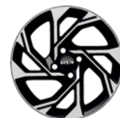
Rin de aluminio 16" EX (TM, TA), EX PACK (TA)