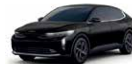
Aurora Black (LX, EX, EX PACK, GT-Line)