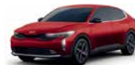
Fiery Red (LX, EX, EX PACK, GT-Line)