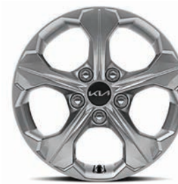
Rin de aluminio 16" 205/65R17 EX