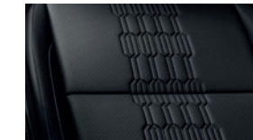
Negro, un tono EX PACK, SX, SXL