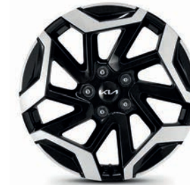
Rin de aluminio bitono 17" 215/60R17 SXL