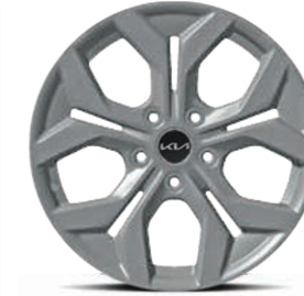
Rin de aluminio 17" 215/60R17 EX PACK, SX